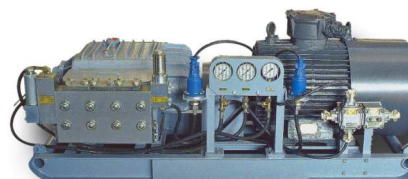
Pompa nurnikowa T-150/30