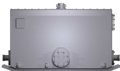
Zespół zbiornika 1000dm 3