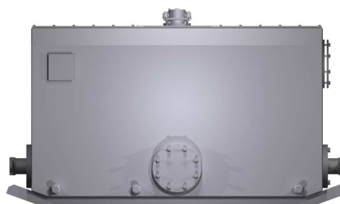
Zespół zbiornika 1000dm 3